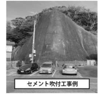
セメント吹付工事例