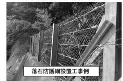
落石防護網設置工事例